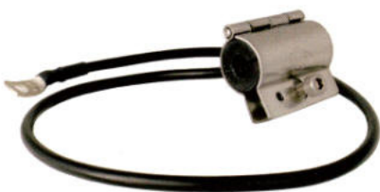
Erdungsschelle für Ecoflex® 10,